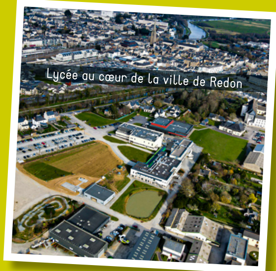
Lycée au cœur de la ville de Redon